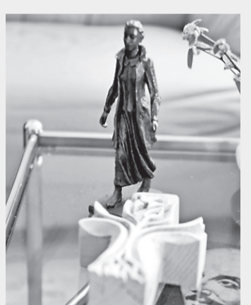
IM BÜRO: Eine kleine Statue von Mary Ward.

261 500 Christen unterschiedlicher Glaubensrichtungen leben in Hannover (Stand 2011). 184 820 von ihnen gehören der evangelisch-lutherischen Kirche an. 71 890 katholisch. 4790 sind evangelischen Freikirchen zugehörig, 12 460 gehören orthodoxen Glaubensrichtungen an. 48 Millionen Christen leben ungefähr in Deutschland. 24 Millionen sind römisch-katholisch, 23 evangelisch-lutherisch. 2,26 Milliarden Menschen auf der Welt gehören dem Christentum an.