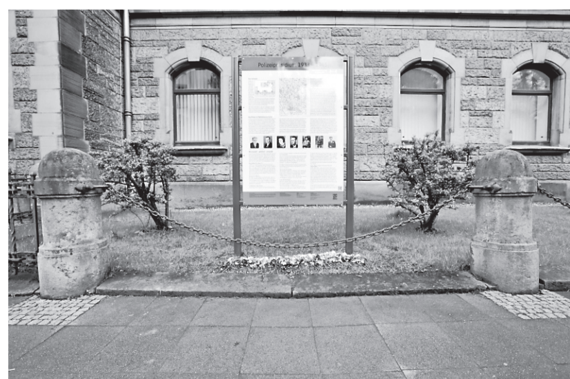
ORT DES VERBRECHENS: Seit Mai erinnert eine Gedenktafel an der Hardenbergstraße an die Opfer der Polizei in der Zeit des Nationalsozialismus.

Weil viele der Sinti und Roma von den Nazis als „Asoziale“ verhaftet worden waren, hatten sie später große Probleme, bei der Wiedergutmachung als rassisch verfolgte anerkannt zu werden. „Die Diskriminierung ging auch nach dem Krieg weiter“, so Schmid.